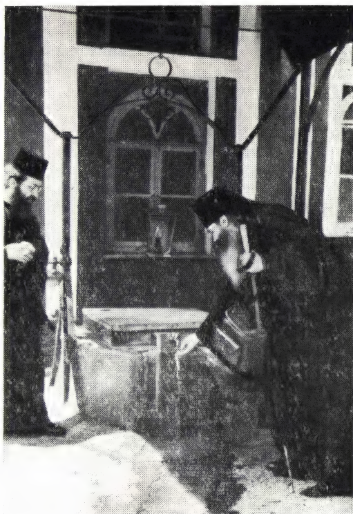
Иверский монастырь. У источника

скому), в основанный им к тому времени Печерский монастырь. Таким образом, благодатные связи с Афоном объединяют в один круг святых Бориса и Глеба, отрока Георгия Угрина и брата его — преподобного Моисея Угрина, таинственного инока-святогорца и спасавшегося от тех же врагов преподобного Антония Печерского.